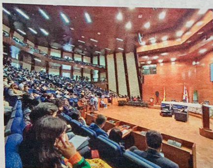
ASISTENCIA. Así lucía parte del auditorio del CICC ayer, durante la primera conferencia magistral.

Dijo que con estos métodos alternativos, "el 50% de los casos